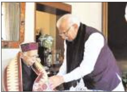
हरियाणा के मुख्यमंत्री मनोहर लाल ने पूर्व उप प्रधानमंत्री व भारतीय जनता पार्टी के वरिष्ठ नेता लाल कृष्ण आडवाणी से नई दिल्ली में उनके आवास पर मुलाकात कर उन्हें सर्वोच्च उपाधि भारत रत्न मिलने पर बधाई दी।